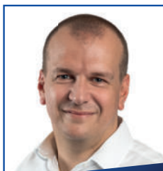
Jiří Zajac starosta Prahy 14